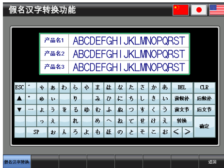
基本画面 B-30001: 假名汉字转换